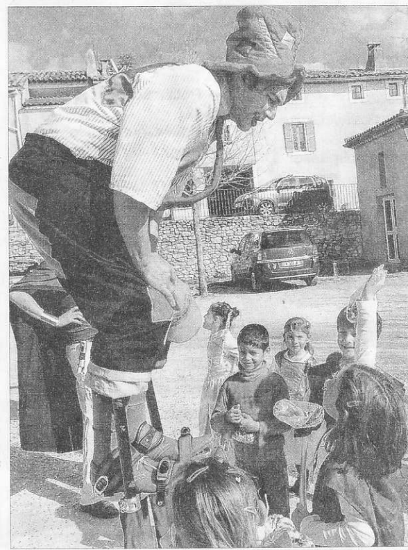
Juché sur de longues échasses, le clown a amusé les enfants