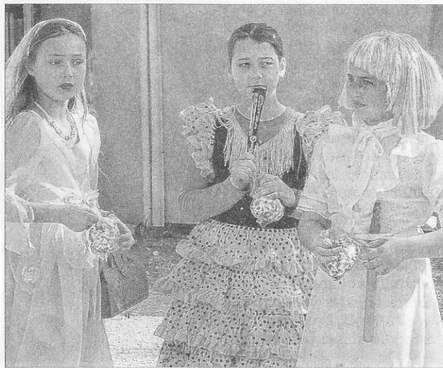
Les jeunes filles étaient élégamment vêtues.

mentran a été brûlé. C'est dans une joyeuse déferlante de personnages mythiques et féeriques, sous une pluie de confettis, que la troupe a ensuite intégré la salle pour assister à un spectacle de clown et déguster un savoureux goûter.