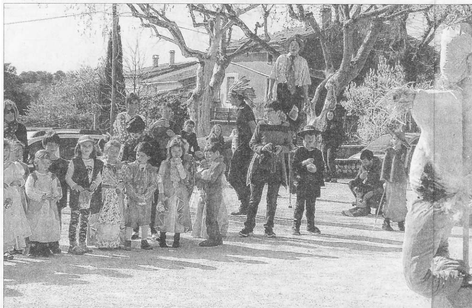
Les enfants se sont retrouvés autour de caramentran.