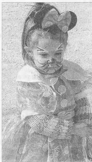
Une jolie poupée